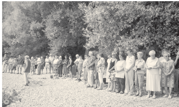
Communion lors du culte du 29 juin à la Pointe du Grain

Toujours autant de succès pour le culte de début d'été sur les galets de la Pointe du Grain! Une bonne centaine de personnes ont entouré les baptêmes de trois catéchumènes. Un apéritif à la Buvette a permis à tous de fraterniser encore après ce moment méditatif consacré au souffle du Joran et à celui de l'Esprit.