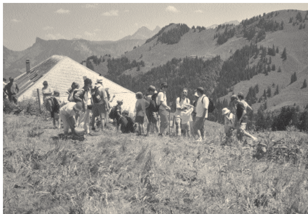
2002, la paroisse en excursion au Gros-Molésion: tout un symbole! Une marche dynamique vers l'avenir, la découverte d'horizons nouveaux

La paroisse du Joran en excursion: dimanche 7 septembre rejoignez le groupe des amoureux de la nature et des marcheurs. La journée, à la fois active et contemplative, commencera à 9 h 20 par la messe à l'abbaye d'Hauterive, suivie de la visite de ces vénérables lieux. Après le pique-nique familial au bord de l'eau, les participants auront le choix entre deux excursions dans les alentours de la Sarine: une marche de 2-3 heures le long de la rivière ou une balade plus modeste. En cas de pluie, la course a quand même lieu et une solution alternative est prévue par le Comité. Inscriptions indispensables par les circulaires déposées dans les quatre temples de la paroisse. Les participants des années précédentes et les familles liées au Culte de l'enfance et au précatéchisme recevront les informations à domicile.