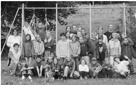
L'équipe du précatéchisme 03-04